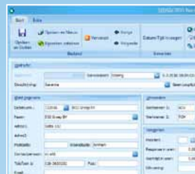
Snelle registratie van storingen of ad hoc werkzaamheden

Daarnaast biedt de module Management Assistent de nodige extra, proactieve functionaliteit voor het nog slagvaardiger kunnen opereren van de organisatie als geheel. Evenals de andere modules binnen UNIT4 Multivers kent ook UNIT4 Multivers Service Manager een verregaande integratie met de Microsoft Office omgeving.