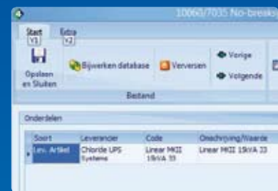
Onderdelen per installatie tot in detail vast te leggen

De servicemonteur kan op locatie interactief communiceren met het UNIT4 Multivers backoffice systeem. Dit gaat via een mobiel apparaat voorzien van Windows Mobile, waarop een voor dit doel ontwikkeld programma draait. Dit speciaal voor monteurs ontwikkelde programma werkt op basis van een draadloze internetverbinding en communiceert rechtstreeks met UNIT4 Multivers Service Manager. Hierdoor is de buitendienstmedewerker in staat om steeds direct alle actuele uit te voeren werkopdrachten in te zien.