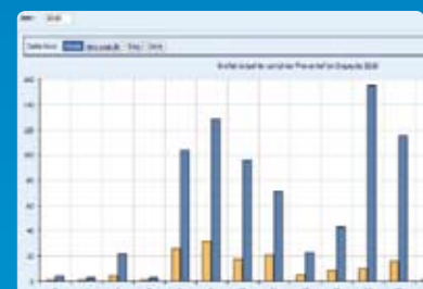
Benodigde capaciteit per periode inzichtelijk